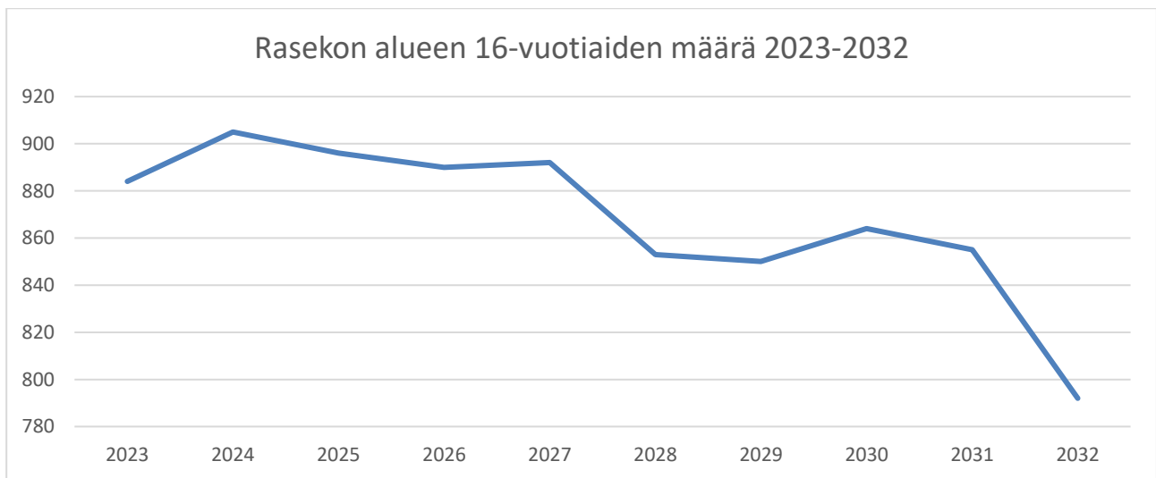
Taulukko 2. Rasekon alueen 16-vuotiaiden määrän kehitys 2023-2032.